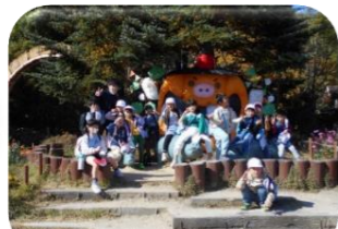
モクモクファーム遠足