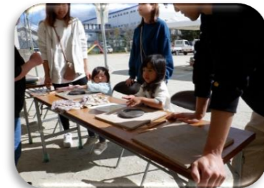
グラウンドゴルフ体験