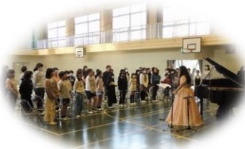
アウトリーチ事業

10月27日(金)アウトリーチ事業として声楽家とピアニストの方に歌や演奏を聴かせて頂きました。10月31日(火)2年生がモクモクファームへ校外学習(遠足)に行き、パン作り体験やミニブタショーなどを見ました。11月6日(月)から朝の駆け足がはじまりました。また同日防災体験として起震車体験や地震が起こればどうするのかなどを学習しました。